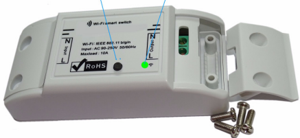
easy WiFi-smart-Switch, www.SMS-GUARD.org