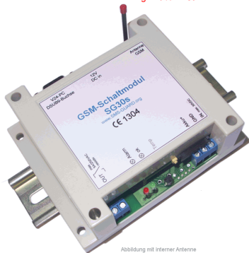
Abbildung mit interner Antenne